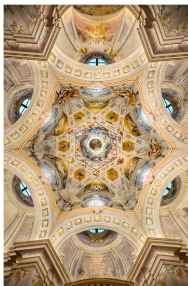
Carignano, cappella Visitazione in località Valinotto (XVIII sec.), volta